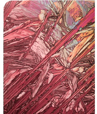
Kaliumkristalle unter dem Mikroskop

Indem sich Kalium gefäßerweiternd verhält und die Ausscheidung seines Gegenspielers Natrium fördert, unterstützt der Mineralstoff den Erhalt eines normalen Blutdrucks.