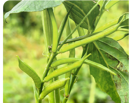
Die Samen der Guarpflanze - eine hochwertige Quelle für naturreine Ballaststoffe

Die Eigenschaften und/oder Merkmale, denen Fiber-Intercell® seine Zweckdienlichkeit in Bezug auf das Reizdarmsyndrom und Obstipation (Verstopfung) verdankt, umfassen: